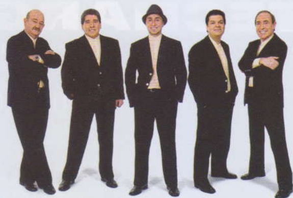
Show de Encerramento com Demônios da Garoa!